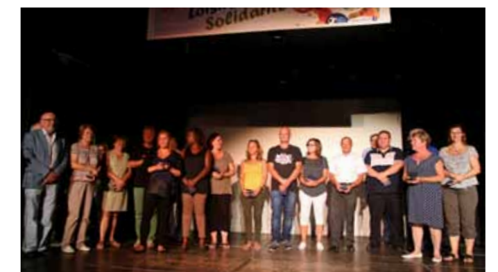
Podiums, 2 septembre