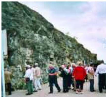
A l’entrée du fort de Vaux

eut lieu la désignation du soldat inconnu qui repose à l’Arc de Triomphe.