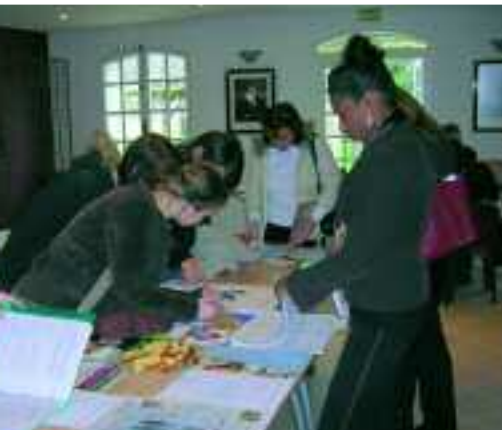
Septembre Forum des associations