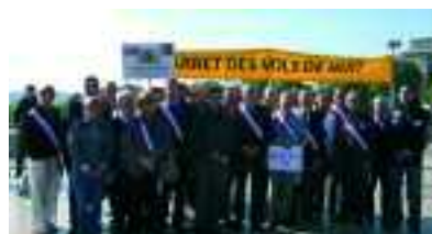
Les élus manifestant le 20 septembre en faveur d'un plan de réduction des vols de nuit

large concertation. Celle-ci sera remise au Président de la République au printemps 2009.