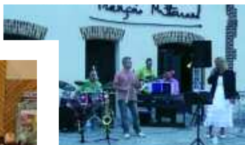
Juin Succès renouvelé d'Othis en Fête